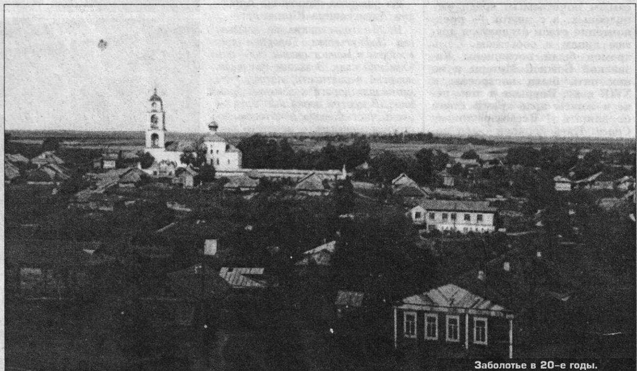
Заболотье в 20-е годы.

Ждем вас в нашем музее. Адрес прежний: Овражный пер., 9а. Тел. 4-44-28.