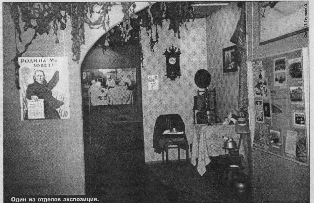
Один из отделов экспозиции.

На ней представлены подлинные вещи, документы, фотографии, живописные работы и плакаты.